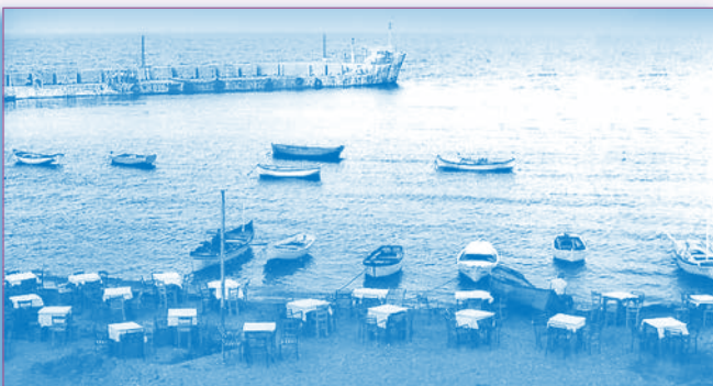
Το τσιμεντόπλοιο στο λιμάνι της Ραφήνας, 1948

Βάσει του βιβλίου «Η εξ Ιθάκης Οικογένεια Δρακούλη», ο Κυριάκος Δρακούλης, εκ Τριγλίας Βιθυνίας της Μικράς Ασίας βρήκε την Ιθάκη του στη Ραφήνα.