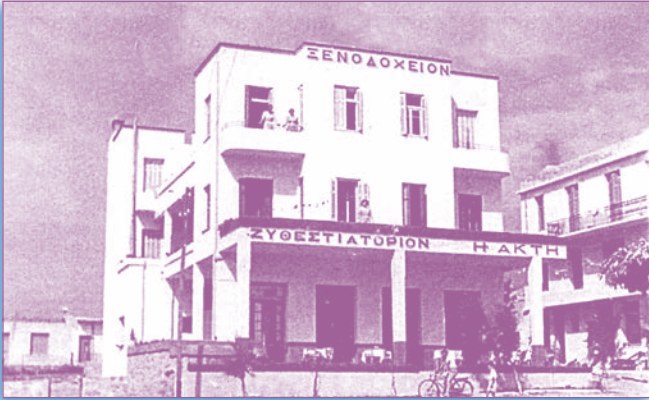
Ξενοδοχείο - Εστιατόριο "ΑΚΤΗ"

Ποίημα της Ρεγγίνας Γελαδά Καίκα, μέλους της χορωδίας του ΛΕΡ