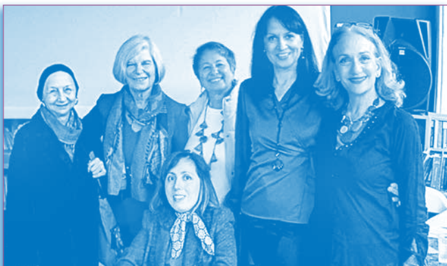
Από την παρουσίαση του βιβλίου στο ΛΕΡ, 26/11/2023

Τα έργα του Θεοτοκόπουλου που αναδεικνύονται στην πλοκή του βιβλίου ανήκουν στην Κρητική Σχολή ζωγραφικής. Το πρώτο, «Η Προσκύνηση των μάγων» εκτίθεται σήμερα στο Μουσείο Μπενάκη στην Αθήνα ενώ το δεύτερο, η εικόνα