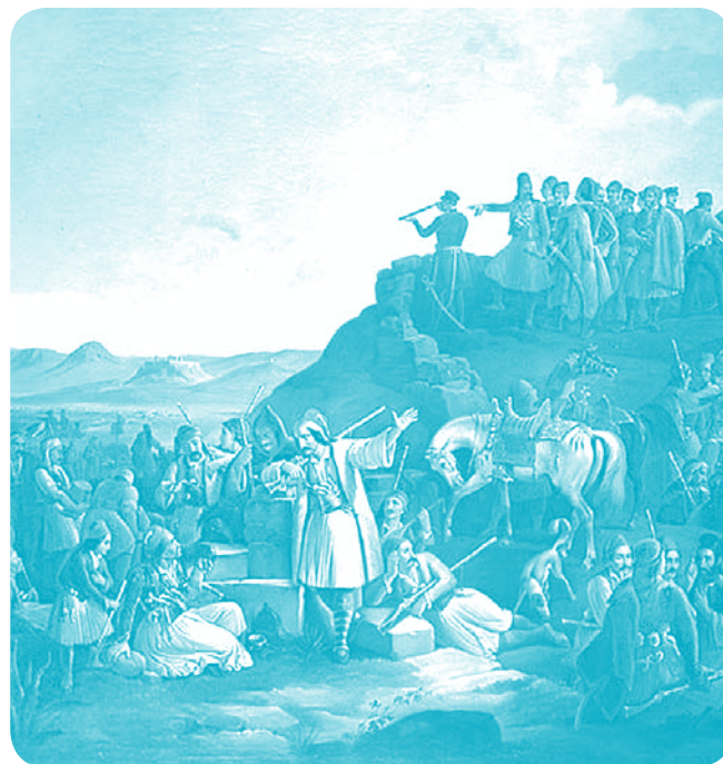
Θ. Βρυζάκης - Το Στρατόπεδο του Καραϊσκάκη στην Καστέλα (1855)