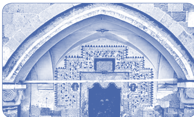
Σινασός. Ναός Αγίων Κωνσταντίνου και Ελένης