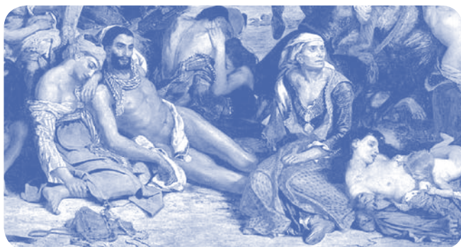
E. Delacroix - Η Σφαγή της Χίου (1822)

Στην Ελλάδα, ένας από τους καλλιτέχνες που άντλησε εξ' ολοκλήρου σχεδόν την εμπνευσή του από την Ελληνική Επανάσταση, είναι ο Θεόδωρος Βρυζάκης. Μόλις επτά χρονών έχασε τον πατέρα του – απαγχονίστηκε από τους Τούρκους – και το 1832 μετακόμισε στο Μόναχο, όπου παρακολούθησε σχολείο ορφανών παιδιών της ελληνικής επανάστασης. Θεωρείται ο πρώτος