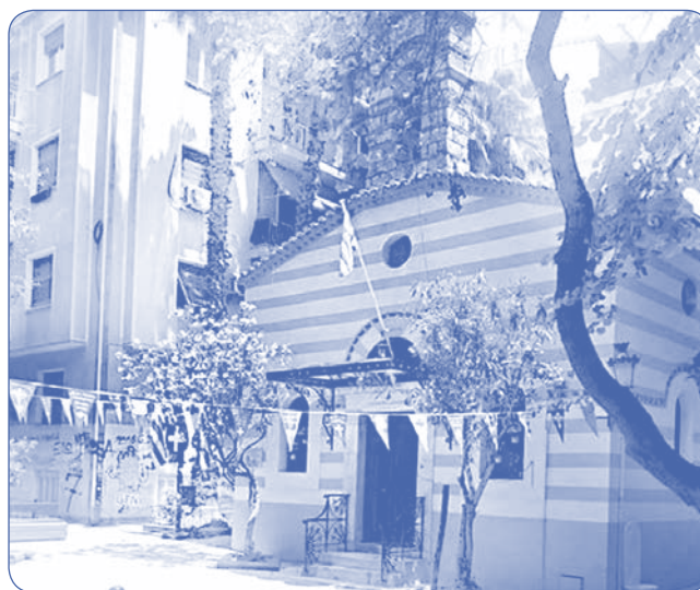
* «ΚΩΝΣΤΑΝΤΙΝΟΣ ΚΑΝΑΡΗΣ Τ' ΟΝΟΜΑ ΜΟΥ» Εκδόσεις «ΚΑΛΕΝΤΗ» 2020

Κι όταν περνάω μπροστά, το άγαλμά του που στέκει ανάμεσα σε πολυκατοικίες έχοντας τριγύρω κεραίες τηλεοράσεων, ακούω να μου ψιθυρίζει πως εκείνου του ταίριαζε να αγναντεύει τη θάλασσα και τις αντένες πλοίων.