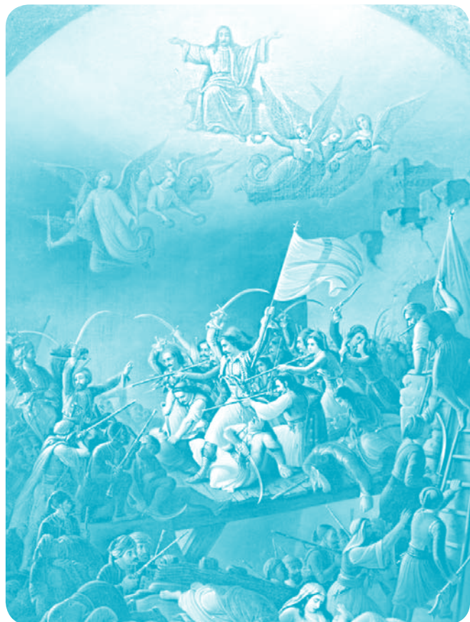
Θ. Βρυζάκης – Η Έξοδος του Μεσολογγίου (1853)

Από τους πρώτους που φιλοτέχνησαν πίνακες με θέμα την ελληνική επανάσταση ήταν ο Γάλλος ζωγράφος Ευγένιος Ντελακρουά (Eugène Delacroix). Το 1822 αποτύπωσε την «Σφαγή της Χίου», έργο το οποίο εκτέθηκε στο Σαλόν του Παρισιού (1824) διεγείροντας την ευρωπαϊκή κοινή γνώμη. Ένα άλλο συγκλονιστικό έργο είναι «Η Ελλάδα στα Ερείπια του Μεσολογγίου» (1826), όπου η Ελλάδα αναπαριστάται ως μια νεαρή γυναίκα, εξασθλιωμένη με σκισμένα ρούχα που στέκεται ανάμεσα στα ερείπια. Φοράει την ελληνική παραδοσιακή φορεσιά ξεκούμπωτη στο στήθος και η στάση της είναι γονατιστή μεν, υποδεικνύοντας την ήττα, αλλά με το σώμα της όρθιο, συμβολίζοντας την επικείμενη νίκη. Τα μάτια της είναι βρεγμένα με δάκρυα, ενώ τα χέρια της είναι ανοιχτά ως ένδειξη απόγνωσης. Στο φόντο διακρίνεται ο εχθρός να καρφώνει μια σημαία στο έδαφος.