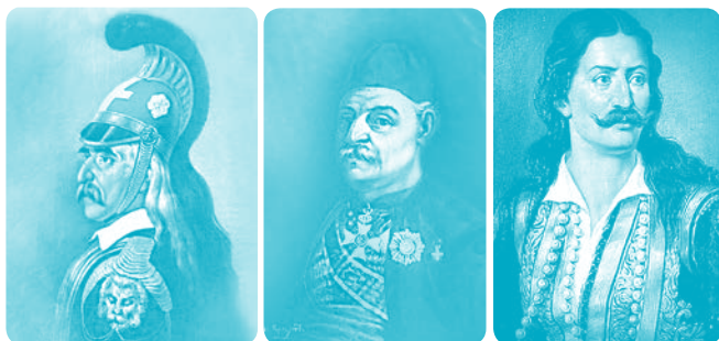
Δ. Τσόκος - Θεόδωρος Κολοκοτρώνης (1861) Α. Κριεζής - Ο Ναύαρχος Ανδρέας Μιαούλης (1841) Δ. Τσόκος - Αθανάσιος Διάκος (1861)

Ο ηρωισμός, η αυτοθυσία και η γενναιότητα των Αγωνιστών του '21 προβάλλονται ως ηθικό πρότυπο και ως μαρτυρία της αδιάλειπτης ιστορικής συνέχειας του ελληνισμού, εμπνέοντας τους νέους ανθρώπους να αναπαράγουν και να επαυξήσουν αυτές τις ξεχωριστές αρετές που στηρίζουν το γένος μας.