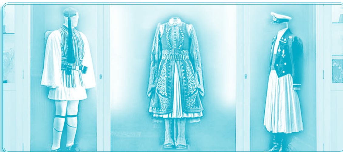
Επετειακά Βιτρίνα στις αίθουσες του Κεντρικού Λυκείου των Ελληνίδων