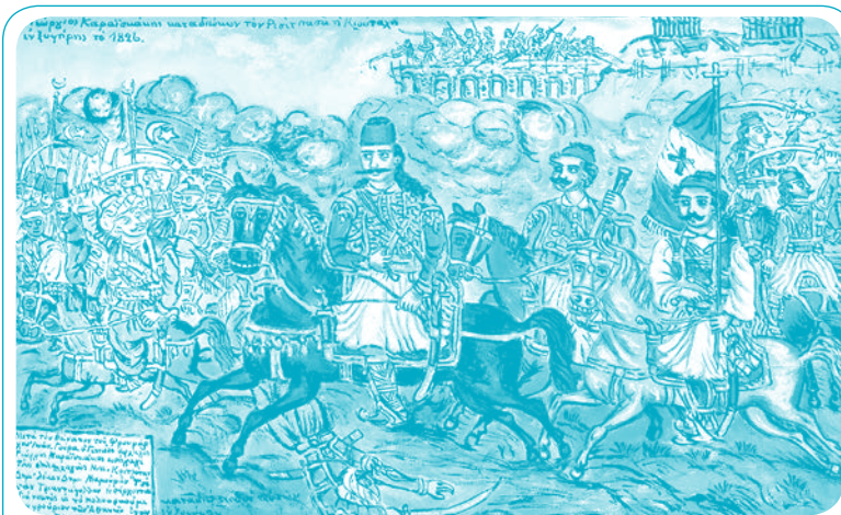
Ο Καραϊσκάκης, επικεφαλής των Ελλήνων, καταδιώκει τον Κιουταχί και τους Τούρκους απ' την Αθήνα το 1827. Έργο του Θεόφιλου.

Ο Γιάννης Ντάβαρης δεν γνωρίζουμε αν πρόλαβε να δει την Ελλάδα ελεύθερη. Γνωρίζουμε ότι τον Ιανουάριο του 1831 έχει πεθάνει. Πρέπει τότε να ήταν ηλικίας