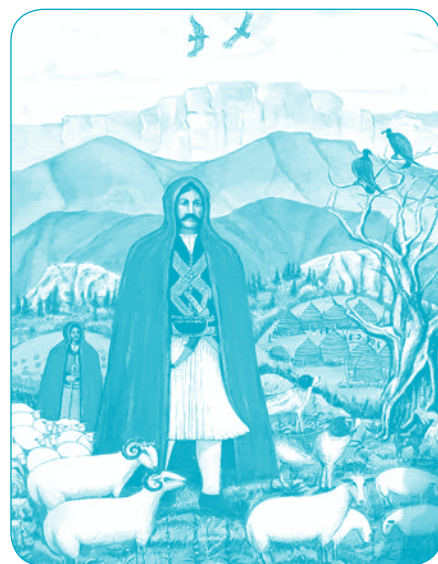
Έργο της εικαστικού Ασπασίας Μπούρα