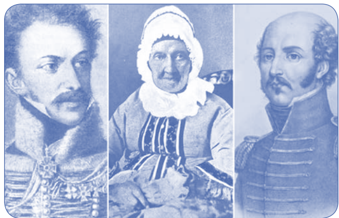
Ελισάβετ Υψηλάντη «η πρωτομάνα των Φιλικών»

Αλέξανδρου, του Δημητρίου και του Νικολάου Υψηλάντη. Αποκαλείτο «πρωτομάνα των Φιλικών», λόγω του ότι δεν δίστασε να προσφέρει όλη την περιουσία της για την ευόδωση των σκοπών της Επανάστασης. Στο αρχοντικό της συγκεντρώνονταν οι Φιλικοί για την οργάνωση της Επανάστασης και εκεί, τον Φεβρουάριο του 1821, ελήφθη η τελική απόφαση για την έναρξη των στρατιωτικών επιχειρήσεων και συντάχθηκε η εμβληματική προκήρυξη « Μάχου υπέρ πίστεως και πατρίδος ». Λίγο πριν υπογραφεί από τον Αλέξανδρο Υψηλάντη η συγκεκριμένη προκήρυξη, σε μια στιγμή μεγαλείου η μητέρα του θέλησε να διαθέσει στον Αγώνα όλη την ακίνητη περιουσία της οικογένειας.