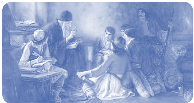
N. Γύζης – Το Κρυφό Σχολειό (1885-6)