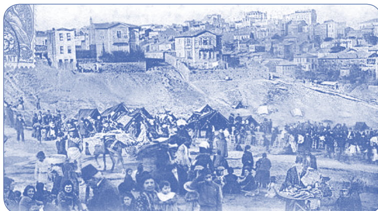
Στη γιορτή του Αν Γιώργη στα Ταταύλα.

Στην πολιορκία του Ναυπλίου την χρησιμοποίησαν για τον ίδιο σκοπό και αργότερα, κατά τις επιδρομές του Ιμπραήμ (1825-26), την απέστειλαν σε μέρη κατεχόμενα από τον εχθρό, για να επιδώσει και να παραλάβει έγγραφα. Μετά τον γάμο της με τον Επτανήσιο ταγματάρχη του