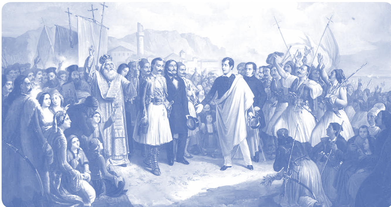
Θ. Βρυζάκης - Υποδοχή του Λόρδου Βύρωνα στο Μεσολόγγι (1861)

ζωγράφος της μετα-Οθωμανικής Ελλάδας και ιδρυτής της Σχολής του Μονάχου, ενώ είναι ένας από τους σημαντικότερους Έλληνες ρομαντικούς ζωγράφους του 19 ου αιώνα. Οι ελαιογραφίες του χαρακτηρίζονται από νοσταλγικό στυλ και ατμοσφαιρικά χρώματα. Μετά τον θάνατό του παραχώρησε όλα τα έργα του ατελιέ του στο Πανεπιστήμιο Αθηνών.