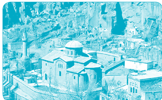
Καππαδοκία. Ναός Αγίου Γρηγορίου στην Καρβάλη