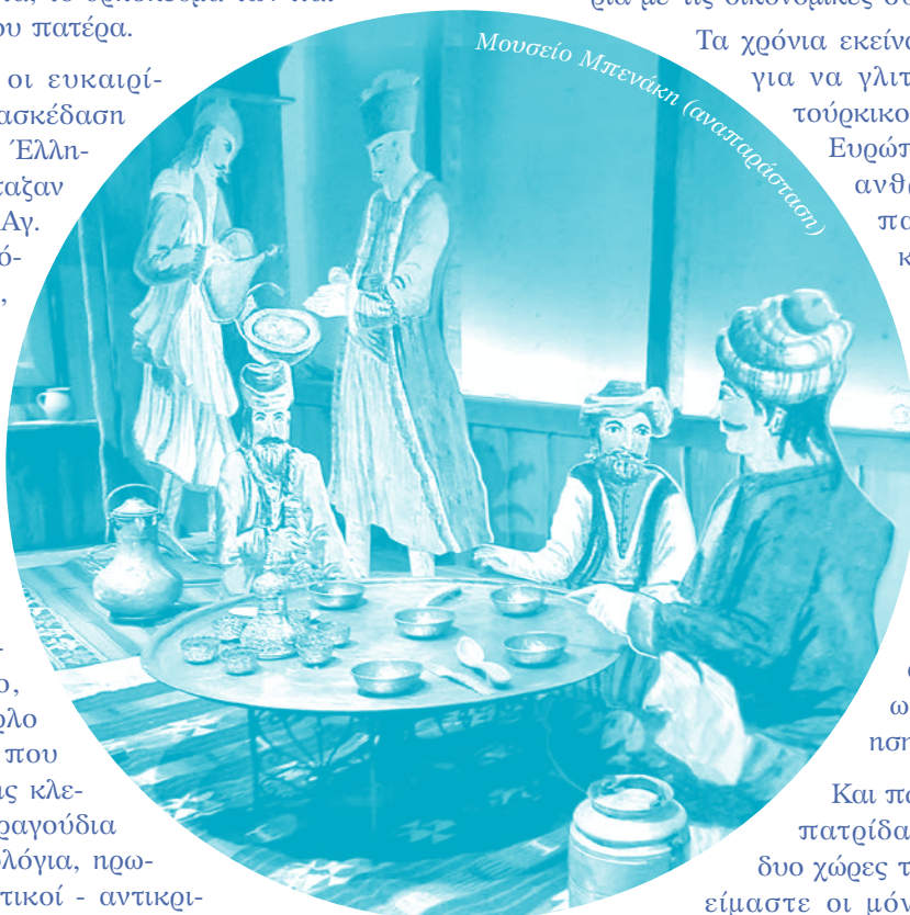
Μουσείο Μπενάκη (επανάσταση)