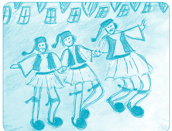
Έργο Μαρίας Κουζούκου , μέλους του ΛΕΡ

Εξώφυλλο: " Σύναξη φουστανελάδων " (Φωτογραφία από την εκδήλωση του ΛΕΡ "200 χρόνια από την Επανάσταση του '21 και Μεσογειότες Αγωνιστές" Ραφίνα 26/09/2021).