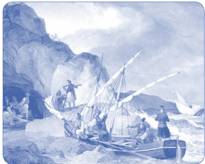
Έλληνες ναυτικοί, 1831. Ελαιογραφία, 0,35x0,40 μ. Carl Wilhelm von Heideck (1788-18...X61)

Όταν έρχεται ο Καποδίστριας στην Ελλάδα τον Ιανουάριο του 1828, αναγνωρίζει τις θυσίες της Μαντώς για την πατρίδα και της απονέμει τον τίτλο της αντιστρατιγού. Μοναδική τιμή για γυναίκα τότε, αλλά και έως σήμερα. Της αναθέτει επίσης τη διεύθυνση του