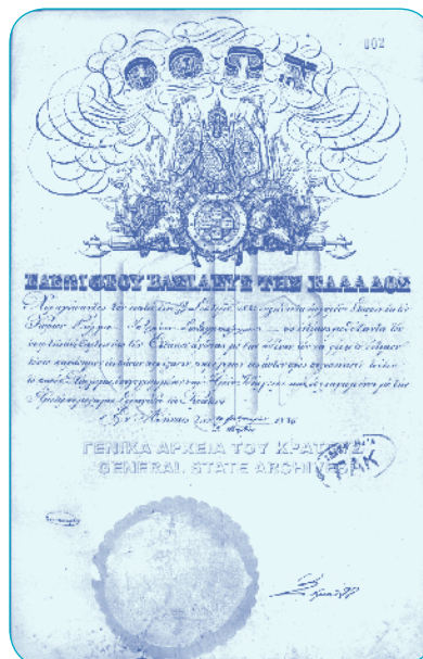
Δίπλωμα Αργυρού Αριστείου στον Συνταγματάχη Γεώργιο Ιατρούκο 12/3/1836

Αλλά πόσοι ήταν ακριβώς αυτοί οι Αγωνιστές που συμμετείχαν στα χρόνια της Επανάστασης; Για να το πούμε διαφορετικά. Πόσοι ήταν οι πρόγονοί μας που πήραν τα σπαθιά και τα τουφέκια και επαναστάτησαν;