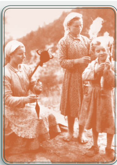
Μικρές γνέστρες στον Όλυμπο