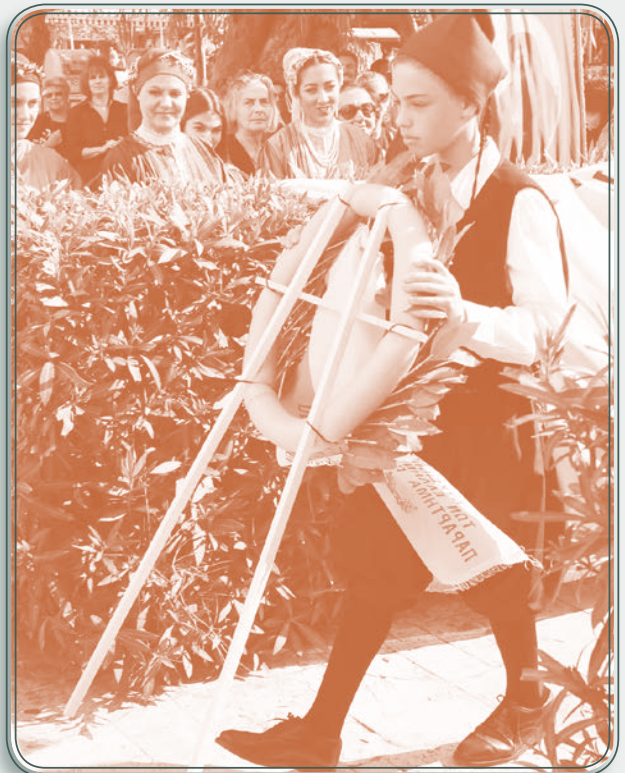
Κατάθεση στεφάνου στη Ραφήνα, 28 η Οκτωβρίου 2019

Εξώφυλλο: Μαθήτριά του Λ.Ε.Ρ. με βλάχικη φορεσιά και πλουμιστή ποδιά.