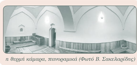
η θερμή κάμαρα, πανοραμικά

Στην πρόσφατη επίσκεψή μας στη Τρίγλια είδαμε το «μεγάλο χαμάμ» να έχει ανακαινιστεί πλήρως και ομολογούμε ότι μας εντυπωσίασε. Προσεγμένη δουλειά! Όπου ήταν δυνατόν χρησιμοποιήθηκαν τα παλιά μάρμαρα, προς το παρόν όμως παραμένει κλειστό.