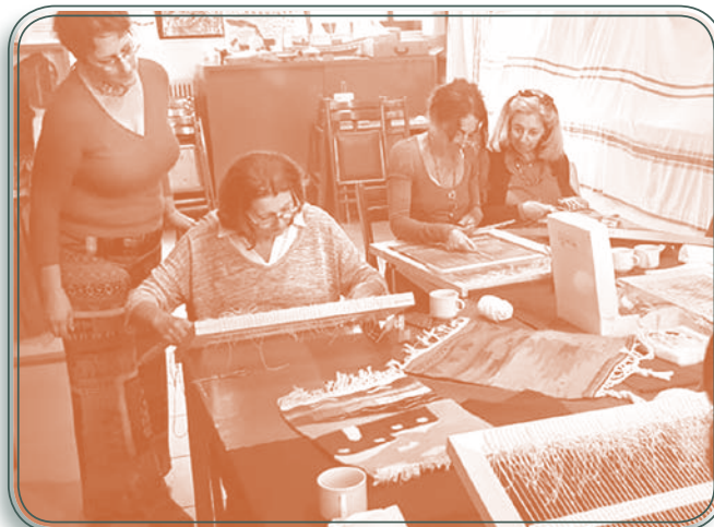
Μάθημα Υφαντικής στο Λ.Ε.Ρ.