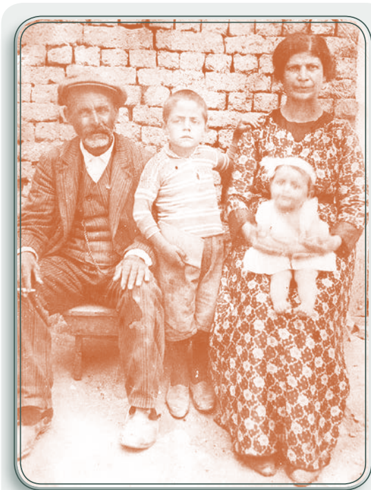
Λίγο πριν την καταστροφή στην Τρίγλια

είπε κι έσκασε ο μπαμπάς μου! Δεν του άρεσαν αυτές οι συμβουλές. Τότες του λέει ο αγάς: "Αφού θέλεις να πας στο Αρμουτσί να πας στο δικό μου νοικοκυριό που'ναι και το πιο καλό". Τότες λοιπόν, δηλαδή κατά μήνα Αύγουστο του 1923, βάζει ο αγάς κάτι μουλάρια με τους υπηρέτες του και μας δίνει 1 σακί κριθάρι, 1 σακί στάρι αλεσμένο, μερικά όσπρια και λίγο αλάτι, γιατί τότε το πιο δυσεύρετο πράγμα ήταν το αλάτι, λίγο σουσαμόλαδο, διότι ελαιόλαδο δεν υπήρχε, καναδυό σιλτέδες, (ένα είδος στρώματος), και μερικά μαγειρικά σκεύη και μας κουβάλησε στο τραγικό αυτό χωριό, ας το πούμε.