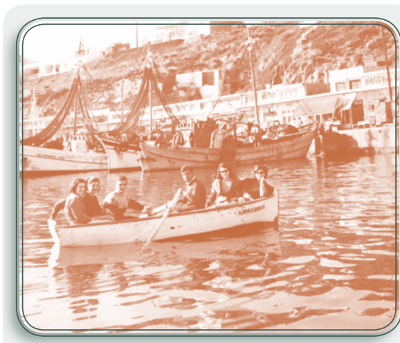
Ραφήνα (Δεκαετία του '70)