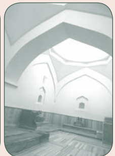
(3) θερμή κάμαρα