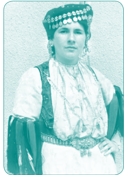
Κασαγκούνα. Νοριτίτσι φορεσιά. Μεγάλα Καλύβια Θεσσαλίας. (Παρέλαση στο Μουσείο Καρόιτσας 1970)

Οι χώρες που κρατούν τα σκίπτρα της παιδικής εργασίας είναι οι χώρες της Ασίας, οι χώρες του Ειρηνικού και οι χώρες της Αφρικής. Λυπάμαι που ο χώρος της στήλης αυτής δεν επιτρέπει για περισσότερες αναλύσεις στα διάφορα θέματα, αλλά, μπορούμε να δώσουμε μια ενημέρωση, πληροφόρηση και τροφή για σκέψεις, στα θέματα της καθημερινότητας που αφορούν τις γυναίκες και τα παιδιά και για τα οποία εργάζεται το Λύκειο των Ελληνίδων. 🍀🍀🍀