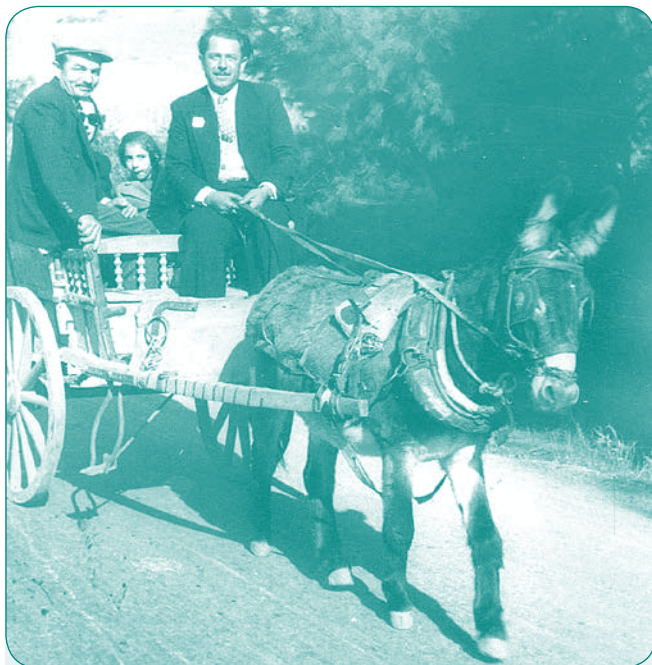
Δεκαετία 1950 (Εκθεση φωτογραφίας Δήμου Ραφίνας-Πικερμίου, 2016)

δίνει, την δένουν στο αυτοκίνητο και ξεκινούν για το ίδιο δρομολόγιο τραγουδώντας, για να μεταφέρουν το χαρούμενο μήνυμα και σε άλλα γειτονικά χωριά.