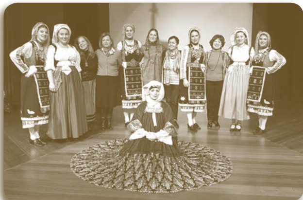
Από την παράσταση του Λ.Ε.Ρ. στο Μποδοσάκειο Δημοτικό Σχολείο του Κολεγίου Αθηνών. 17.2.2017