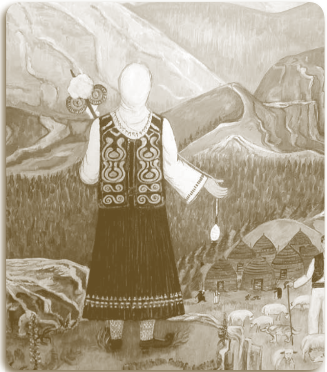
Σαρακατσαναίοι: Έργο της ζωγράφου Ασπασίας Μπούρα

Το βράδυ έγινε τρικούβεργο γλέντι ως το πρωί, με τραγούδια της τάβλας. Το πρωί της Δευτέρας πια, στην αυλή του κονακιού, του γαμπρού τα κορίτσια στρώσανε τρία χράμια και ξεσακιάσανε τα προικιά. Τροβάδια, σα-