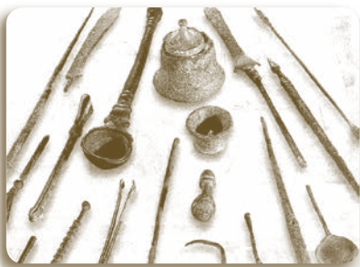
Ιατρικά εργαλεία Μουσείου Επιδαύρου

Οι ακραίες στιγμές του πόνου των ανθρώπων προ-κάλεσαν, όπως την κατά τόπο ονοματολογία των ασθε-νειών, έτσι και την κατά τόπο Παρα-δοσιακή Θεραπευ-τική, που κινιό-ταν σε εμπειρικά και Θρησκευτικά πλαίσια. Οι μαγι-κές και δεισιδαι-μονικές δοξασίες οδήγησαν τις θερα-πευτικές γνώσεις τους από γενιά σε