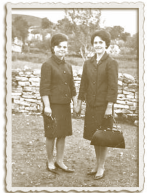
Τελειόφοιτη Γυμνασίου, με το Πασχαλινό ταγεράκι.

ους» κι έπειτα θα τρώγαμε κι εμείς. Μετά το Πάσχα και τα σουβλιστά αρνιά, που «έχει δεν έχει κάποιος, αυτή τη μέρα θα σουβλίσει», έλεγε πάλι η μάνα, εμείς ζούσαμε περιμένοντας... το Γαϊτανάκι. Σ' αυτό το κλίμα, με το κτύπημα της καμπάνας την Τρίτη το απόγευμα έπρεπε να είμαστε στο δρόμο για την Εκκλησία. «Γρήγορα» πρόσταζε η μητέρα μου. «Θα έρθουν οι ξωμάχοι, πριν από μας. Ντροπή!». Σαν «ήρωες» φάνταζαν στο μυαλό μου οι «ξωμάχοι», που ζούσαν κατά φαμίλιες κοντά στα χωράφια τους, σε μεγάλα σόγια της εποχής, Μπεσέικα, Καραθανασέικα, στην Πουρνάρα και στο Μαύρο Βουρό. Στην απογευματινή λειτουργία νόμιζα ότι ο παπάς βιαζόταν λίγο για να αρχίσει η μεγάλη γιορτή. Ήταν πράγματι μεγάλη γιορτή.