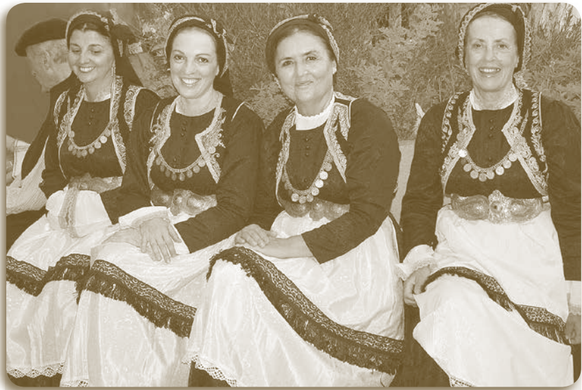
Μαθήτριες του ΛΕΡ με φορεσιές Βοβούσας - 3.8.2016