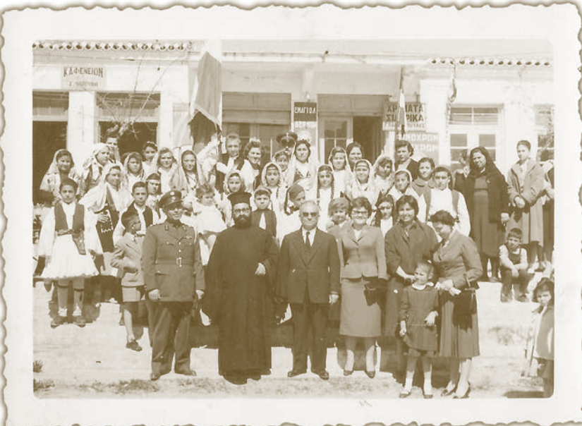
Ραφήνα, Δεκαετία '50

Από τις πρώτες του προτεραιότητες ήταν να ολοκληρώσει τον περιβάλλοντα χώρο του Ναού και στην συνέχεια να γίνει το κεραμίδωμά του. Μετά έρχονται οι καμάρες, το καμπαναριό, το στρώσιμο με μωσαϊκά του περιβάλλοντος χώρου του Ναού και τέλος η αγιογράφισή του που ξεκίνησε και τελείωσε με τον ίδιο Ζωγράφο - Αγιογράφο Μάριο