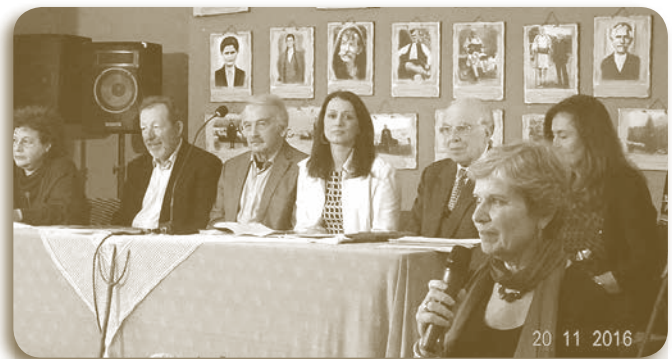
Ημερίδα για τους Σαρακατσάνους - 20.11.2016