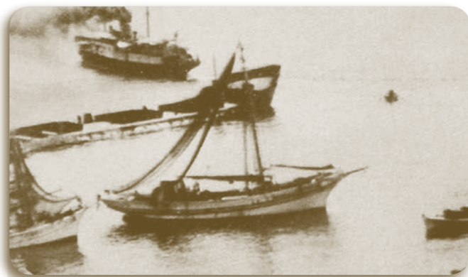
1948 - Το τσιμεντόπλοιο έφτασε στη Ραφήνα. Αριστερά το «Κάρυστος».

Το τσιμεντόπλοιο ρυμουλκήθηκε από το Πέραμα μέχρι τη