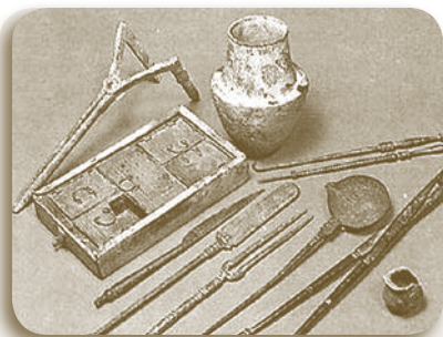
Μίλην, η. Χειρουργικόν εργαλείον, δ'ιού ερευνάσι τας πληγάς, και βάλλουσιν εν ανταίς τα ιατρικά. Άρα καθετήρ, κ.τ.τ. Specillum

Δύσκολοι οι καιροί γενικά και τότε (18 ος -19 ος αιων.) με τους ευφρείς πρακτικούς γιατρούς και φαρμακοπαρασκευαστές, μελετητές και ιστορικούς να ασχολούνται με επιμονή στην καταγραφή συνταγών που χρησιμοποιούσαν παθόντες και έγιναν καλά." Ο παθός είν γιατρός" έλεγαν και όσους ασχολούνταν, τους θεωρούσαν σαν θεούς "πρώτα ο Θεός και δεύτερα οι Άγιοι και ο Γιατρός" έλεγαν στην Κύπρο και πίστευαν πως "μόνον ψυχή να βάλει εμ μπορεί ο γιατρός"!