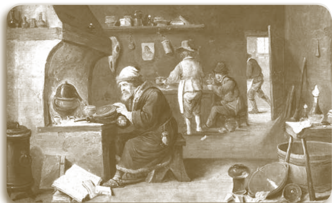
Το εργαστήρι του Αλχημιστή

Όπως είπαμε στο προηγούμενο τεύχος από τα Βυζαντινά Μοναστήρια ξεκίνησε η χειρόγραφη κατάθεση για θεραπείες, χειρουργικές επεμβάσεις και συνταγές "...δια τας χρείας και ανάγκας πενήτων ανθρώπων..." (1724-Στ. Μουλαΐμης, Αντιδοτάριον)