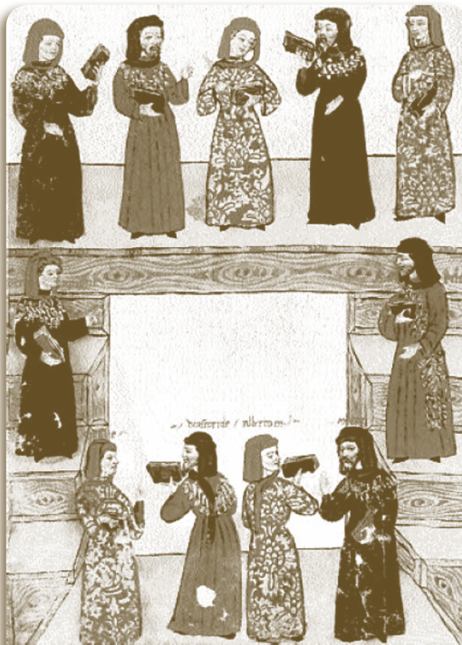
1. Οι γεννήτορες της ιατρικής και της φαρμακολογίας (εξικινώντας από επάνω, από αριστερά προς τα δεξιά): Ασκληπιός, Ιπποκράτης, Αβικέννας, Ραζής, Αριστοτέλης, Γαληνός, Μάσερ, Αλβέρτος ο Μέγας, Διοσκορίδης, Μεσουέ, Σεραπίων. Χειρόγραφο του Γιουχάνε Κα-ντεμόστο, 15ος αι.