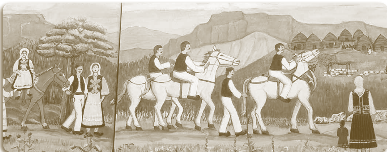
Σαρακατσάνικος γάμος: Έργο της ζωγράφου Ασπασίας Μπούρχα

Βούιζαν οι ρεματιές και αντιλαλούσαν τα πλάγια από το τραγούδι, που το έπαιρναν μια οι άντρες, μια οι γυναίκες. Οι σχαριάτες, 12 τον αριθμό, κατά το έθιμο, ξεκόψαμε από το συμπεθεριακό, για να αναγγείλουμε τον ερχομό του. Φθάνοντας, αλλάξαμε το μπουκάλι με το κόκκινο κρασί, την κουλούρα του γαμπρού με την κουλούρα της νύφης, μία πάνω, μία κάτω, τρεις φορές. Πήραμε στα γρήγορα ένα γλυκό και γυρίσαμε στους άλλους, για να φτάσουμε όλοι μαζί. Μας καλοδέχτηκαν