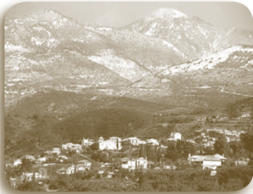
Αγναντεύοντας, από την Αγία Σοφία τη χιονισμένη κορυφή της "κυρά Βγένας".

τη Μυρτιά, την Αγία Σοφία έως το Θέρμο, έχασκαν στο πέρασμα του χρόνου θυμίζοντάς μας τα μαρτυρικά γεγονότα. Οι Άγιες ημέρες του Πάσχα, σε όσους ακολουθήσαμε την εσωτερική μετανάστευση μεταπολεμικά, μας γεμίζουν μια γλυκιά νοσταλγία.