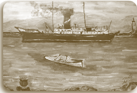
Το «Κάρυστος» - Ζωγραφική απεικόνιση στα πλαίσια του Περιβαλλοντικού Προγράμματος με θέμα "Ιστορία του Λιμανιού της Ραφήνας", το οποίο πραγματοποιήθηκε από μαθητές του 2 ου ΤΕΕ Ραφήνας το σχολικό έτος 2006-2007