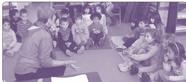
Ξεναγηση στο ΛΕΡ. 19/3/2014

06/01/2014: Την ημέρα των Θεοφανίων, 4 κορίτσια και 2 αγόρια με παραδοσιακές φορεσιές συμμετείχαν στην τελετή της κατάδυσης του Σταυρού στο λιμάνι της Ραφίνας.