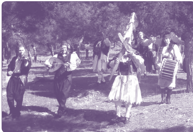
Αναπαράσταση του εθίμου.

Έφθναν στο πρώτο σπίτι, όπου ο προύχοντας γνωρίζοντας την τιμή που του κάνουν, τους περίμενε στην