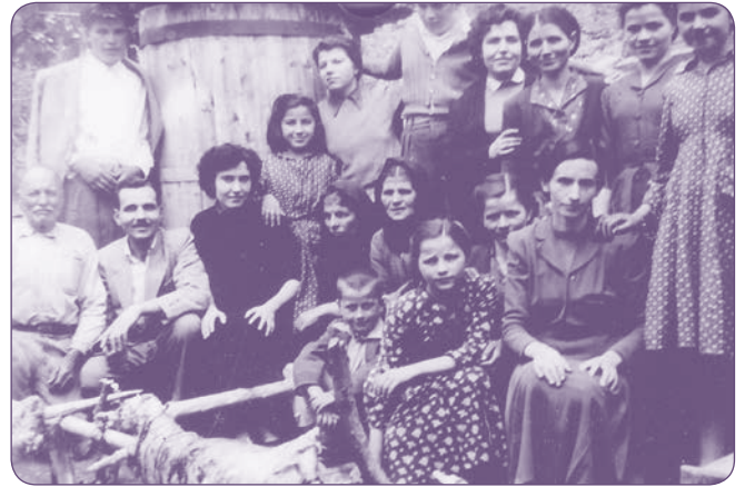
Παύλιανη, Πάσχα 1955

Το Λύκειο ενίσχυσαν οικονομικά: Ελευθερίου Ελένη, Κωνσταντοπούλου Βέτα, Κουρή Μαρία, Ραπτοπούλου Άννα, Παπαδόπουλος Γερβάσιος, Καχριμάνη Ελένη.