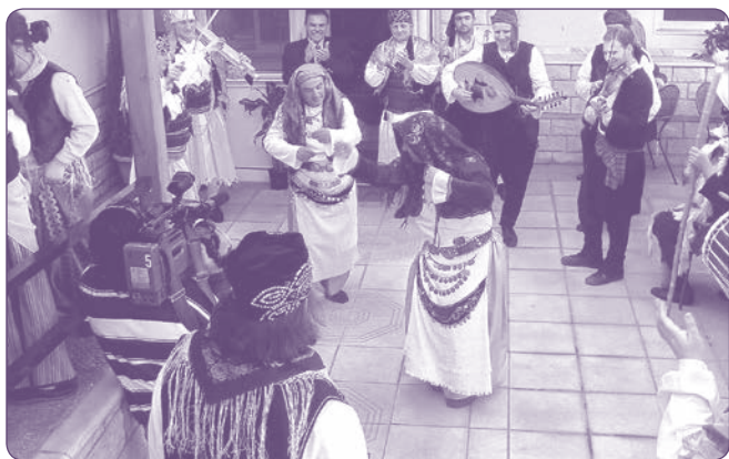
Καρσιλαμάδες και Ζειμπέκικα

Στο τέλος οι ομάδες κατέληγαν διαδοχικά στον αστυνομικό σταθμό, όπου οι χωροφύλακες παρότι τρώμαζαν στη θέα του σπλισμού με τον οποίο ήταν ζωσμένα τα παλικάρια, τους υποδέχονταν φαινομενικά με καλή διάθεση. Νύχτωνε, όταν επέστρεφαν στα σπίτια τους. Ξεντύνονταν και τακτοποιούσαν τα ρούχα στα μπαούλα, για να τα χρησιμοποιήσουν πάλι τις επόμενες αποκριές.