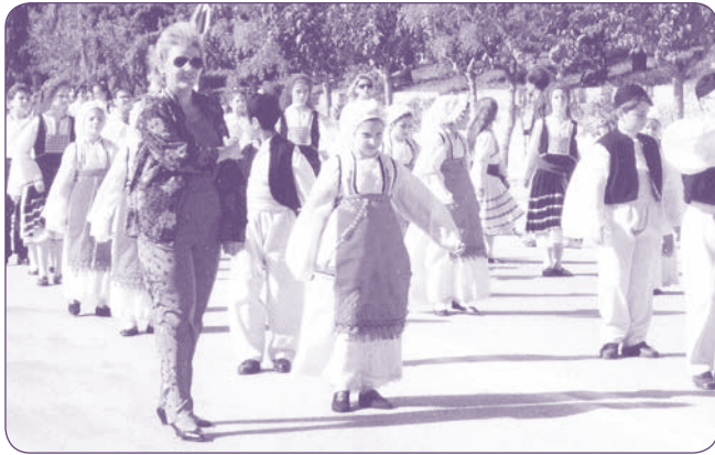
Ραφήνα, παρέλαση 28ης Οκτωβρίου 1994 (Οδηγεί και συνοδεύει τους μικρούς μαθητές του ΛΕΡ)