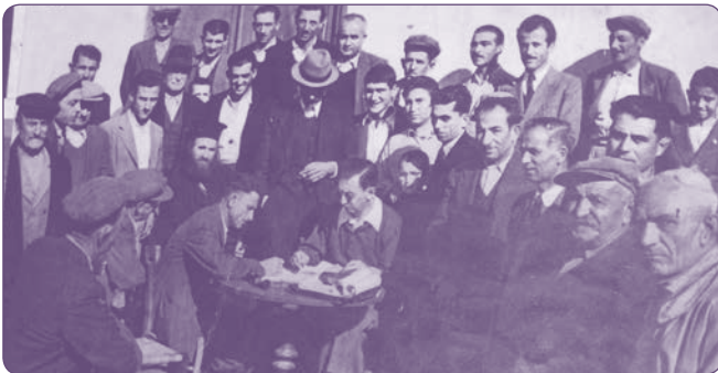
Ερανός για την εκκλησία. Δεκαετία '40.