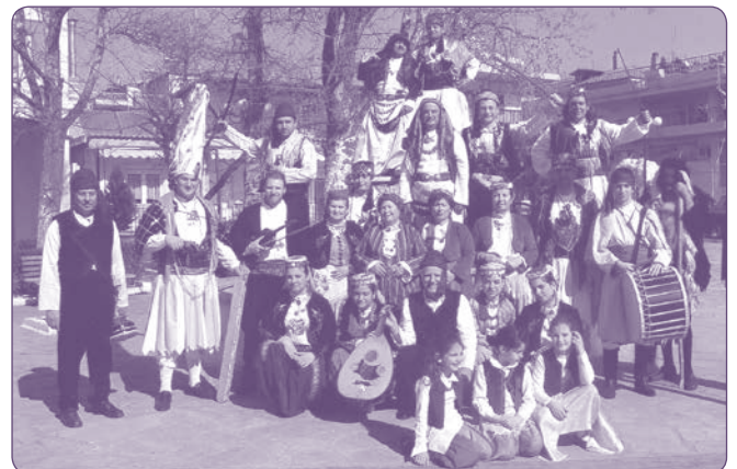
Μικρασιατικός σύλλογος "Ουσάκ" Νέας Ευκαρπίας Θεσ/νίκης

Τα κατιντζίκια , δηλαδή οι γυναίκες της ομάδας, ήταν άνδρες ντυμένοι με γυναικεία ρούχα. Το ένα κατιντζίκι παρίστανε τη νύφη και τα άλλα τις φίλες της. Φορούσαν παραποιημένη γυναικεία ενδυμασία, που αποτελούνταν από φόρεμα ή σαλβάρι, μπλουζα και αμάνικο γιλέκο, πόρπη στο ύψος της κοιλιάς. Στο κεφάλι έριχναν ένα πολύχρωμο μαντίλι. Μπορούσε να υπάρχει ένα κατιντζίκι, μία νύφη ή και δύο και τρία κατιντζίκια στην ίδια ομάδα. Το ρόλο αυτό έπαιρναν μικροκαμωμένοι άνδρες. Πολλοί είχαν και μουστάκι.