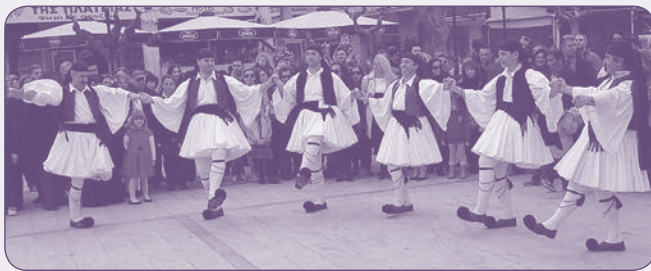
Στην πλατεία της Ραφίνας

« Τ' ανάβλεμμα »: περιοδική έκδοση του Λυκείου των Ελληνίδων Ραφίνας. - Εθνικής Αντιστάσεως 34, 190 09 Ραφίνα - τηλ./fax: 22940 22608 - e-mail: lykellrafinas@gmail.com