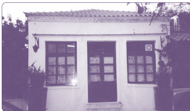
Η παλιά ταβέρνα του Εγκρέ