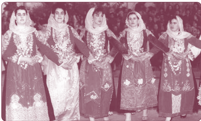
Τράτα Μεγάρων 1991

Εξάλλου, η κοινότητα , μέχρι τα μέσα του 19ου αιώνα, αποτελούσε τη βάση της κοινωνικής οργάνωσης και του τρόπου ζωής όπου συναιρούνταν όλες οι δραστηριότητες των ανθρώπων, διαμορφώνονταν αξίες, αναπτύσσονταν η κοινοτική αλληλεγγύη και οι δεσμοί συνοχής, ενώ καλλιεργούνταν το αίσθημα του ανήκειν στην συγκεκριμένη κοινότητα. Με τη διάλυση του κοινοτικού συστήματος η κοινοτική αλληλεγγύη αντικαταστάθηκε με τις πελατειακές σχέσεις γεγονός που ενθάρρυνε τον ατομισμό και την κινητικότητα των πληθυσμών της υπαίθρου στα μεγάλα αστικά κέντρα.