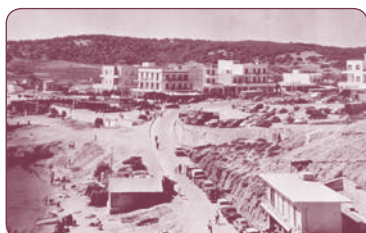
Λιμάνι Ραφήνας μεταπολεμικά