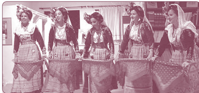
Προετοιμασία για την εν πλω παράσταση, Σεπτ. 2014.