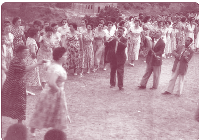
Κρασιά Ασπροποτάμου 1958

Το σημαντικό όμως είναι η αποσύνδεση από την κοινωνική λειτουργία των χορών, εφόσον τώρα δεν εκτελούνται στα χοροστάσια και στις πλατείες των χωριών, αλλά σε κλειστούς χώρους και όχι σύμφωνα με τις επιταγές των εθίμων, αλλά με σύγχρονες χορογραφίες που έχουν σκοπό να διασκεδάσουν και να εξυπηρετήσουν και οικονομικές σκοπιμότητες. Επιπλέον, ο παραδοσιακός τρόπος εκτέλεσης των μουσικών οργάνων αλλάζει και ο συλλογικός χορός με τα παραδοσιακά συμβολικά μέσα έκφρασης εξαφανίζεται. Παράλληλα, παρατηρείται η ανάγκη διάσωσης και διάδοσης των παραδοσιακών χορών , η αναβίωση του παραδοσιακού, για να προωθηθεί η ιδιαίτερη ταυτότητα μιας ομάδας και να ενισχυθεί η αίσθηση του ανήκειν. Βέβαια οι νεωτεριστικές και παραδοσιακόμορφες αυτές απομιμήσεις συνιστούν το φαινόμενο του φολκλορισμού, έννοιας παρεξηγημένης σήμερα εφόσον έχει συνυφανθεί με την εμπορευματοποίηση αφού τίθεται και στην υπηρεσία του τουρισμού. Μουσικοχορευτικές σκηνοθετημένες παραστάσεις, ιερές τελετουργίες (Αναστενάρια), δρώμενα του δωδεκαήμερου (Ρογκατσάρια, Μωμόγερο κτλ) αποτελούν απολαυστικό θέαμα για τουρίστες, ντόπιους και ξένους.