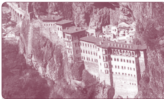
Παναγία Σουμελά, Τραπεζούντα, Πόντος

Σε άλλη μαρτυρία πάλι από το Φερτέκ, την περιφέρεια Νίγδης διαβάζουμε: «Η μητέρα μου έβαζε σε επτά πιάτα από το φαί αυτό και το μοίραζε σε επτά σπίτια. Δεν ξέρω τη σημασία του αριθμού αυτού. Λογούσαλικ της Παναγίας λέγαμε το έθιμο αυτού του φαγητού. Γιατί, όταν γέννησε η Παναγία, τέτοιο φαί της δώσανε και έφαγε. Μαζί με το ερσέ στέλναμε στα σπίτια και επτά πιάτα γιαούρτι. Το γιαούρτι δίνει φως, λέγαμε...».