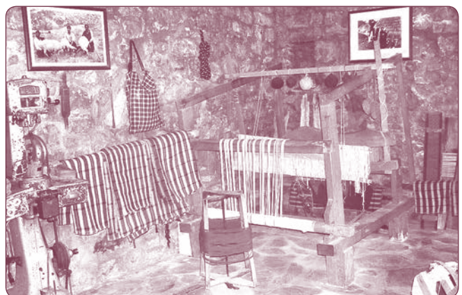
Λαογ. Μουσείο. Σπίτι ποιητή Κ. Κρυστάλλη.