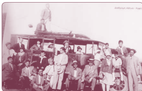
Αθήνα-Ραφίνα, το πρώτο λεωφορείο

Ο διοικητής του λιμανιού έμεινε τότε στο σημερινό σπίτι του κ. Κωνσταντίνου Καραμανλή, του πρώην πρωθυπουργού. Κάποια Χριστούγεννα έστησε ένα χριστουγεννιάτικο δέντρο στην πλατεία, η οποία ήταν τότε συρματοπλεγμένη, και κάλεσε τα παιδιά της Ραφίνας να πάνε να φάνε γύρω από το δέντρο. Εμείς, δεν πήγαμε. Δεν μας άφησε ο πατέρας μας. Κάποια