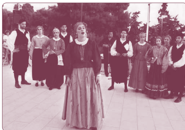
Λύκειο των Ελληνίδων Ραφίνας (Αθήνα 2011)

ΒΙΒΛΙΟΓΡΑΦΙΑ: 📖 Ν. ΓΥΦΤΟΥΛΑΣ «Χορευτική πράξη και κοινωνική συμπεριφορά στον νεοελληνικό πολιτισμικό πεδίο» 📖 στο Ελληνική Χορευτική πράξη: παραδοσιακός και σύγχρονος χορός , ΕΑΠ, Πάτρα 2003 📖 Ε. ΣΠΑΘΑΡΗ - ΜΠΕΓΛΙΤΗ «η Κοινότητα ως πολυσύνθετος οργανισμός» στο Ο νεότερος λαϊκός πολιτισμός , ΕΑΠ, Πάτρα 2002 📖 Λ. ΔΡΑΝΔΑΚΗ «Ο αυτοσχεδιασμός στον Ελληνικό Δημοτικό Χορό, Αθήνα 1993».