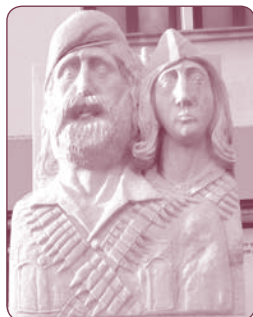
Μνημείο Εθν. Αντίστασης στη Ραφίνα