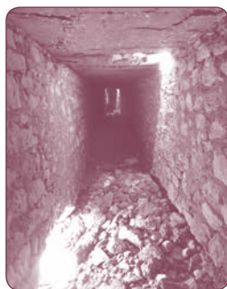
Μαρίκες, διάδρομος που συνδέει τα δύο πολυβόλαια