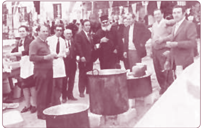
Κεσέκι στα Μελλίσσια, δεκαετία '70

δ) Καθιερώνουν ζωοθυσίες στα θεμέλια των κτισμάτων γιατί η θυσία του ζώου διέπεται από φόβο και ευχή για «στερεή οικοδομή». Το πρόβατο ή βόδι που έσφαζαν με σκοπό να μαγειρέψουν το κεσέκι για το γαμήλιο τραπέζι παραπέμπει στην ευχή και προσδοκία να «στεριώσει» ο γάμος. Το δε σπασμένο σιτάρι ως αρχέγονη τροφή του μικρασιατικού κόσμου, ως σπόρος και καρπός