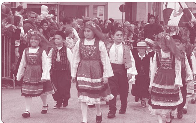
Ραφίνα, παρέλαση 28ης Οκτωβρίου 2014

14/09/2014: Μέρα εθνικής μνήμης της γενοκτονίας των Ελλήνων της Μικράς Ασίας. Το Λ.Ε.Ρ συμμετείχε στον εορτασμό της Ομοσπονδίας προσφυγικών σωματείων Ελλάδος με δέηση στην Αγία Ειρήνη, παρέλαση και κατάθεση στεφάνων στον Άγνωστο Στρατιώτη. Εκπροσώπησε το σύλλογο Μικρασιατών Ανατολικής Αττικής με 4 μαθήτριες της χορευτικής ομάδας, μικρασιατικής καταγωγής, ντυμένες με φορεσιές Τρίγλιας